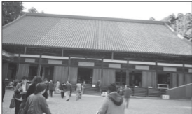
Ko e taha eni e tempale n'a'e langa he ta'u 700 tupu' ne 'ikai a'u ki ai e penūkula' kae laiki la 'e he mofuke'