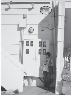
Fakaofuoa ki he fo'i faka'longa 'oku stakale'i 'ali'ali atū, ko e ma'olunga la 'o e penū ne a'u ki ai 'i he loto foma' pea ko e tokotaha ena 'oku tu'u 'i lalo' pea ke faka'utanga ki he ma'olunga 'o e penū 'i he maumau na'a ne fakahoko