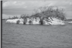
Ko e taha eni e kī'i motu na'e toki hanga 'e he penūkula' la 'o fakaava e motū' 'o hangē ha fanga kī'i matapaā'