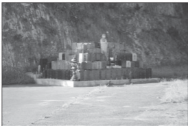
Ko e taha ena e ngaahi fa'itoka ne tātānaki mai ki ai e ngaahi hui 'o kinautolu ne tafia 'e he penūkula' 'o toe tana fakataha he fa'itoka ko ena