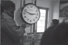
Ko e taha ena e ngaahi asā' toku tauhi 'i he midime' 'oku tu'u tomi pē he taimi ne hoko ai e mofuke' 'i he 2011