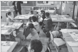
Ko e ako' la 'i Sīpani he taimi' ni kuopau pē ke tu'o taha he silke e ako fekau'aki mo e fakatamaki fakamatulā' pea ko e anga ena e tokateu ki ha mofuke