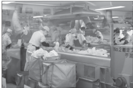
Ko e kau ngiote eni 'i he fale lingi'anga vevé' 'oku 'ea conditions pea 'oku nau fi-fifi e ngaahi pelesitiki pe fanga k'fi ukamea kehekehe 'oku pipiki he pepa' 'o fakamavahe'i