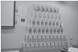
Ko e ngaahi pepa tolotiti ena la 'oku ngaahi pe mei he pepa 'oku tāmaki 'e he kakai' ko e vevé 'o toe fakatau fakalotofomua pea toe uta ki mui