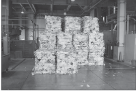
Ko e fale tāmaki pe lingi'anga vevé ena 'oku nau hanga pe 'o ha'i pe no'o fakapoloka 'a e vevé pepa' 'o fakatau la ki he ngaahi kastaha ngaahi pepa tolotiti' ko e silini lahi atu