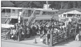
Ko e tu'u lauta ena 'a e fu'u kakai he taha e ngaahi koto pe nafa 'iloa 'o e koto na'e uesia lahi taha 'e he penakula