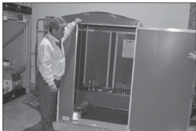
Ko e taha ena e ngaahi tolotiti fakataimi 'oku 'iki ngiote' aki ha fo'i huo in ka 'oku 'osi pe pea lingsi ki ai e kemikale 'o liliu pe vevé la 'o efuefu