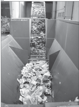
Ko e fu'u misini ena 'oku tokoni ki hono fakafalekehekehe'i 'o e vevé pepa' pea toe fetuku ki he kakai 'oku nau toe fūfū faka'a'auhiakange 'a e vevé