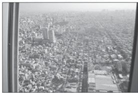
Ko e fōtūnga enā 'a e loto kolo' 'i he'ete tu'u mei he mā'olunga ko e mita 'e 350 mei he fakahi kekekele'