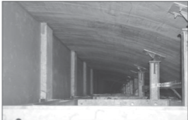
Ko e piki enā 'a e taua' ki he lotomōhe 'o e taua' 'a ia ko mofu'ike 'e se'he pē konga ia ko eni 'i lalo' 'i he la'i' atā kae tu'uma'u pē konga ia 'oku piki ki ai